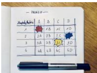
Abb. Prinzip der morphologischen Matrix.