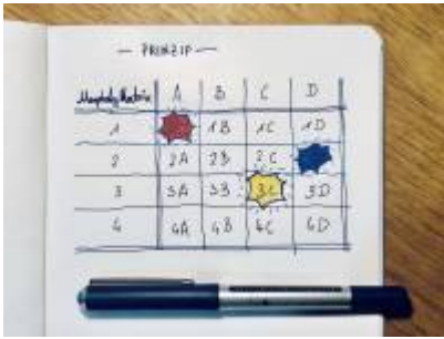
Abb. Prinzip der morphologischen Matrix.

bzw. Ihres Erachtens am meisten potential haben weiter entwickelt zu werden. Heben Sie diese visuell in Ihrer Matrix hervor. In der unteren Abbildung sind dies beispielhaft die Ansätze 1A , 3C und 2D .