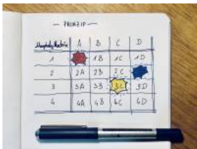
Abb. Prinzip der morphologischen Matrix.