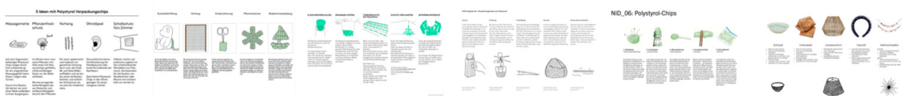
Beispiele aus vergangenen Semestern.

Ergänzen Sie Ihre Ansätze, wie im oberen Beispiel durch Ideenscribbles . Ein PDF der Top 5 Ansätze wird vor der nächsten Unterrichtseinheit im Mattermost Kanal der Klasse gepostet.