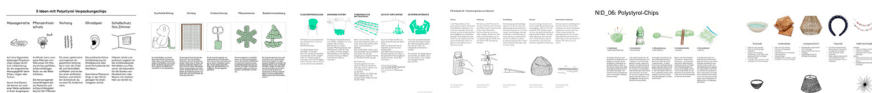
Beispiele aus vergangenen Semestern.

Ergänzen Sie Ihre Ansätze, wie im oberen Beispiel durch Ideenscribbles . Ein PDF der Top 5 Ansätze wird vor der nächsten Unterrichtseinheit im Mattermost Kanal der Klasse gepostet.