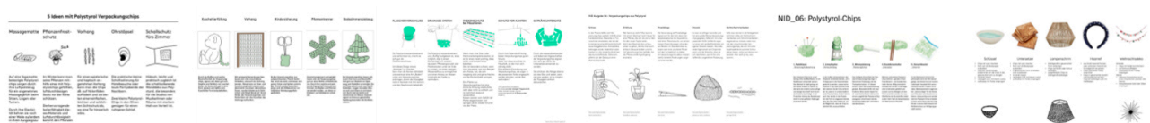
Beispiele aus vergangenen Semestern.

Ergänzen Sie Ihre Ansätze, wie im oberen Beispiel durch Ideenscribbles . Ein PDF der Top 5 Ansätze wird vor der nächsten Unterrichtseinheit im Mattermost Kanal der Klasse gepostet.