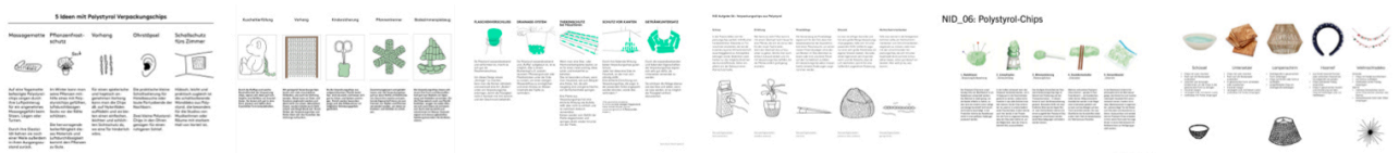
Beispiele aus vergangenen Semestern.

Ergänzen Sie Ihre Ansätze, wie im oberen Beispiel durch Ideenscribbles . Ein PDF der Top 5 Ansätze wird vor der nächsten Unterrichtseinheit im Mattermost Kanal der Klasse gepostet.