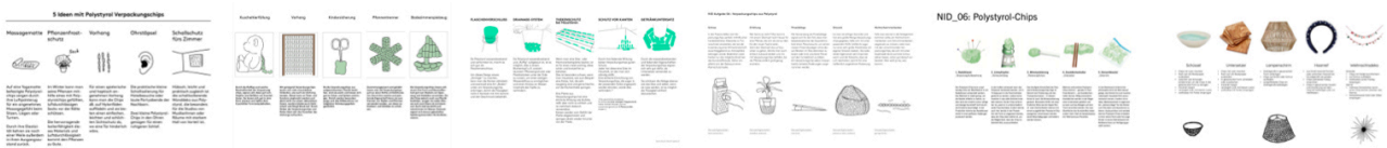
Beispiele aus vergangenen Semestern.

Ergänzen Sie Ihre Ansätze, wie im oberen Beispiel durch Ideenscribbles . Ein PDF der Top 5 Ansätze wird vor der nächsten Unterrichtseinheit im Mattermost Kanal der Klasse gepostet.