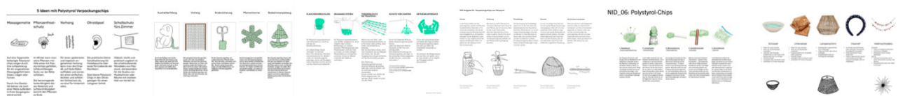
Beispiele aus vergangenen Semestern.

Ergänzen Sie Ihre Ansätze, wie im oberen Beispiel durch Ideenscribbles – also Handzeichnungen oder auch KI-Generierten Bildinhalten, die dabei helfen sollen den Kontext Ihres Ansatzes zu erklären.