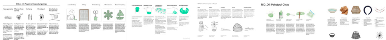
Beispiele aus vergangenen Semestern.

Ergänzen Sie Ihre Ansätze, wie im oberen Beispiel durch Ideenscribbles – also Handzeichnungen oder auch KI-Generierten Bildinhalten, die dabei helfen sollen den Kontext Ihres Ansatzes zu erklären.