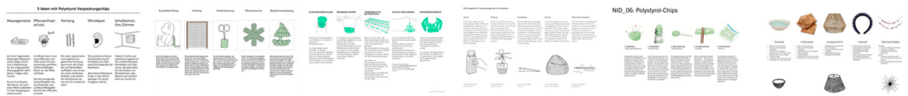
Beispiele aus vergangenen Semestern.

Ergänzen Sie Ihre Ansätze, wie im oberen Beispiel durch Ideenscribbles – also Handzeichnungen oder auch KI-Generierten Bildinhalten, die dabei helfen sollen den Kontext Ihres Ansatzes zu erklären.