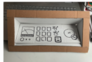
verschiedene Versionen für die Oberfläche, um mehr (X) für rechtshänder angepasst