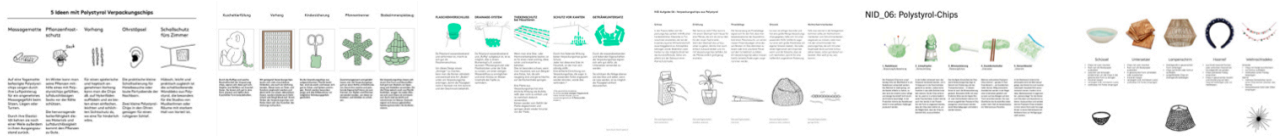
Beispiele aus vergangenen Semestern.

Ergänzen Sie Ihre Ansätze, wie im oberen Beispiel durch Ideenscribbles – also Handzeichnungen oder auch KI-Generierten Bildinhalten, die dabei helfen sollen den Kontext Ihres Ansatzes zu erklären.