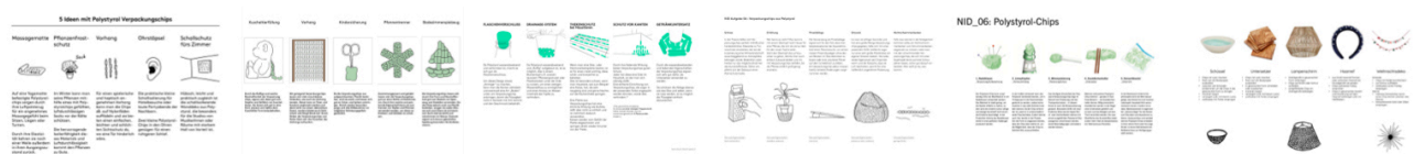
Beispiele aus vergangenen Semestern.

Ergänzen Sie Ihre Ansätze, wie im oberen Beispiel durch Ideenscribbles – also Handzeichnungen oder auch KI-Generierten Bildinhalten, die dabei helfen sollen den Kontext Ihres Ansatzes zu erklären.