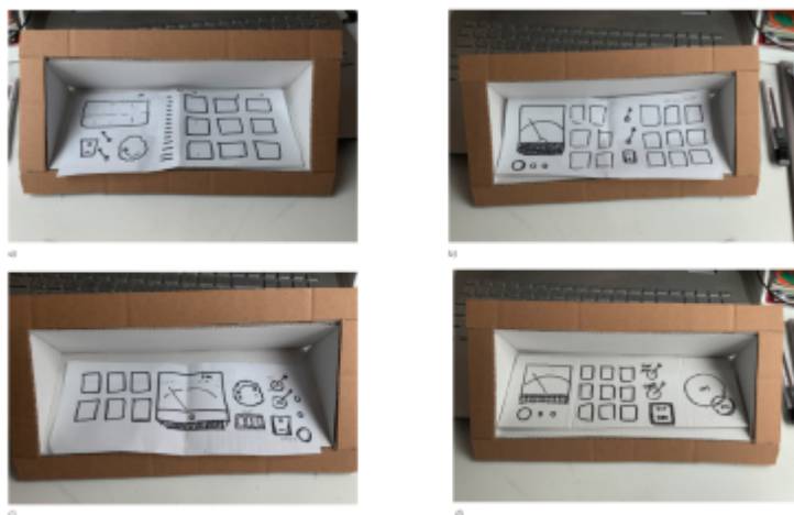
verschiedene Versionen für die Bedienfläche, um mehr (d) für rechtsläufige angepasst