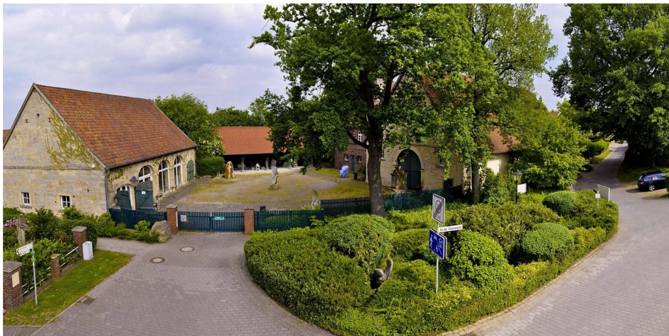
Baumberger Sandsteinmuseum, Havixbeck

Im WiSe 2024/25 wird es eine Kollaboration mit dem Baumberger Sandsteinmuseum in Havixbeck geben.