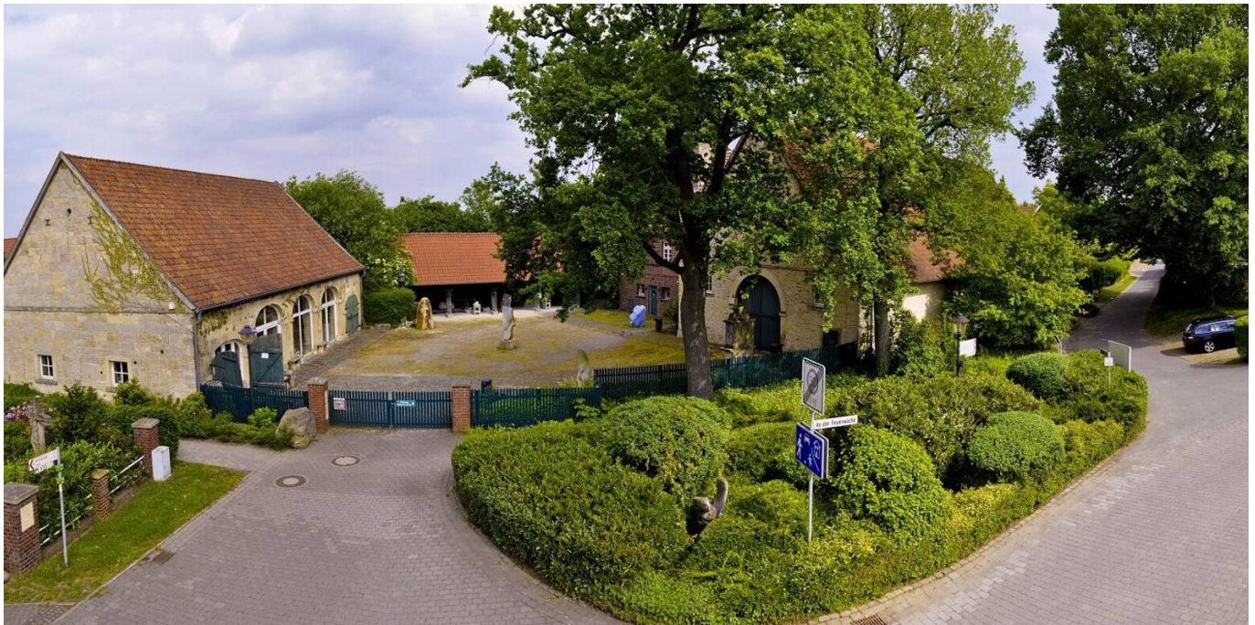
Baumberger Sandsteinmuseum, Havixbeck

Im WiSe 2024/25 wird es eine Kollaboration mit dem Baumberger Sandsteinmuseum in Havixbeck geben.