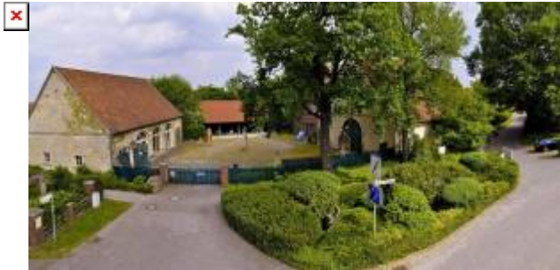
Baumberger Sandsteinmuseum, Havixbeck

Im WiSe 2024/25 wird es eine Kollaboration mit dem Baumberger Sandsteinmuseum in Havixbeck geben.