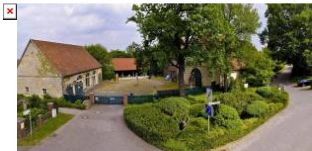
Baumberger Sandsteinmuseum, Havixbeck

Im WiSe 2024/25 wird es eine Kollaboration mit dem Baumberger Sandsteinmuseum in Havixbeck geben.