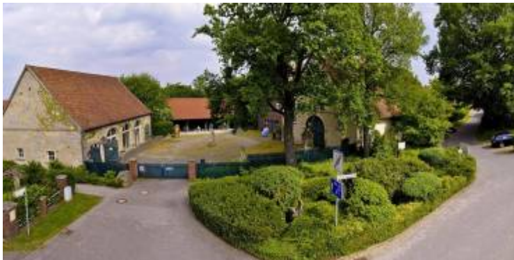
Baumberger Sandsteinmuseum, Havixbeck

Im WiSe 2024/25 wird es eine Kollaboration mit dem Baumberger Sandsteinmuseum in Havixbeck geben.